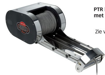
PTR lier met boegrol