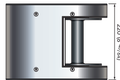
Afmetingen in mm (inch)

Multifunctionele kaapstanders. De modellen van de PT-serie zijn speciale elektrische kaapstanders die ontworpen zijn om het anker aan boord van een ponton of boten te hijsen waar weinig ruimte tot beschikking is. Het kan eenvoudig boven of onder het dek worden geïnstalleerd. PT-modellen kunnen ook worden gebruikt op hengelsportboten of om uw volgboot aan boord van uw jacht te tillen. De drum kan een strip van 48 mm lang en 7,5 m lang ophalen.